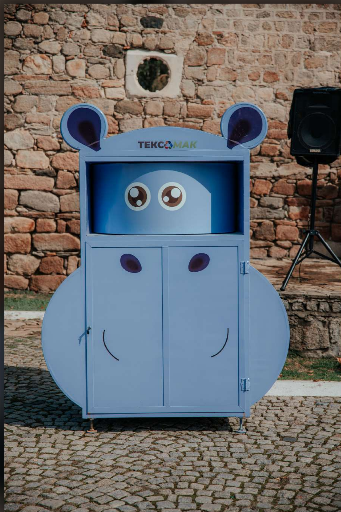
Првиот Хипо контејнер.